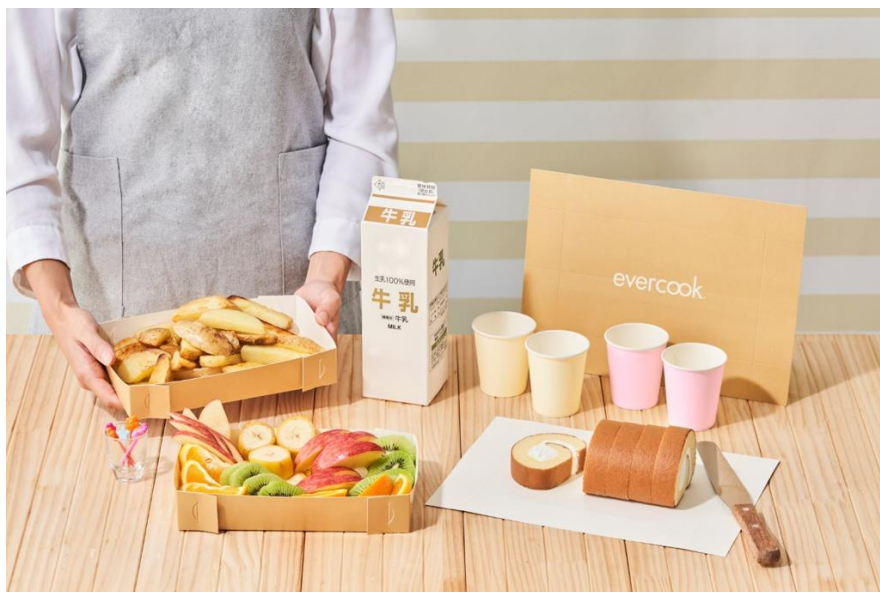
牛乳パック屋さんで作ったペーパーまな板